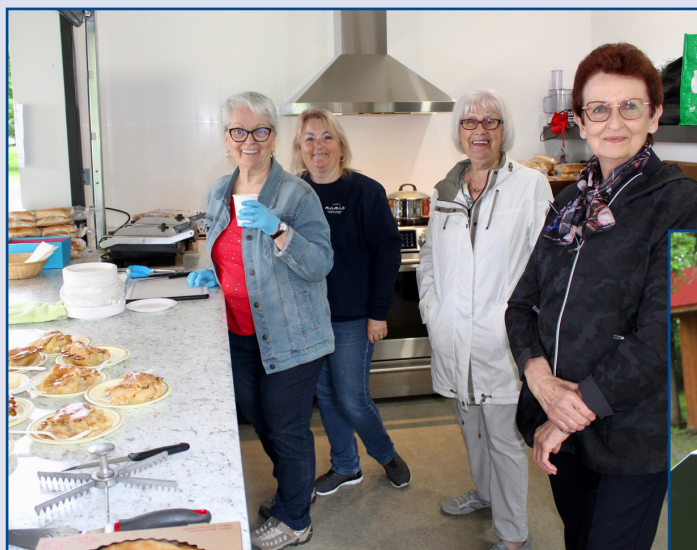
← Les cuisinières