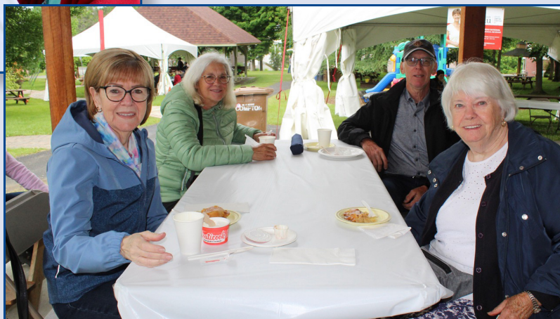
→ D'autres convives